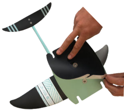
4 - Collez la protection sur la platine Paste the top plate protection