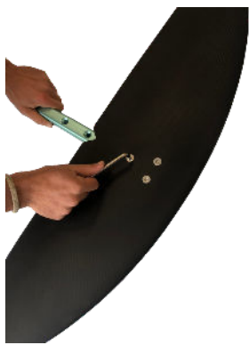
1 - Vissez l'aile avant au fuselage Screw the front wing to the fuselage