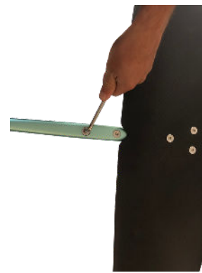
3 - Vissez le fuselage au mât Screw the fuselage to the mast