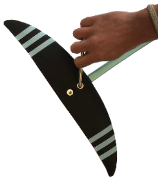
2 - Vissez le stabilisateur au fuselage Screw the stab to the fuselage