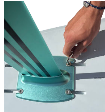
6 - Vissez le foil sur la planche Screw the foil on the board